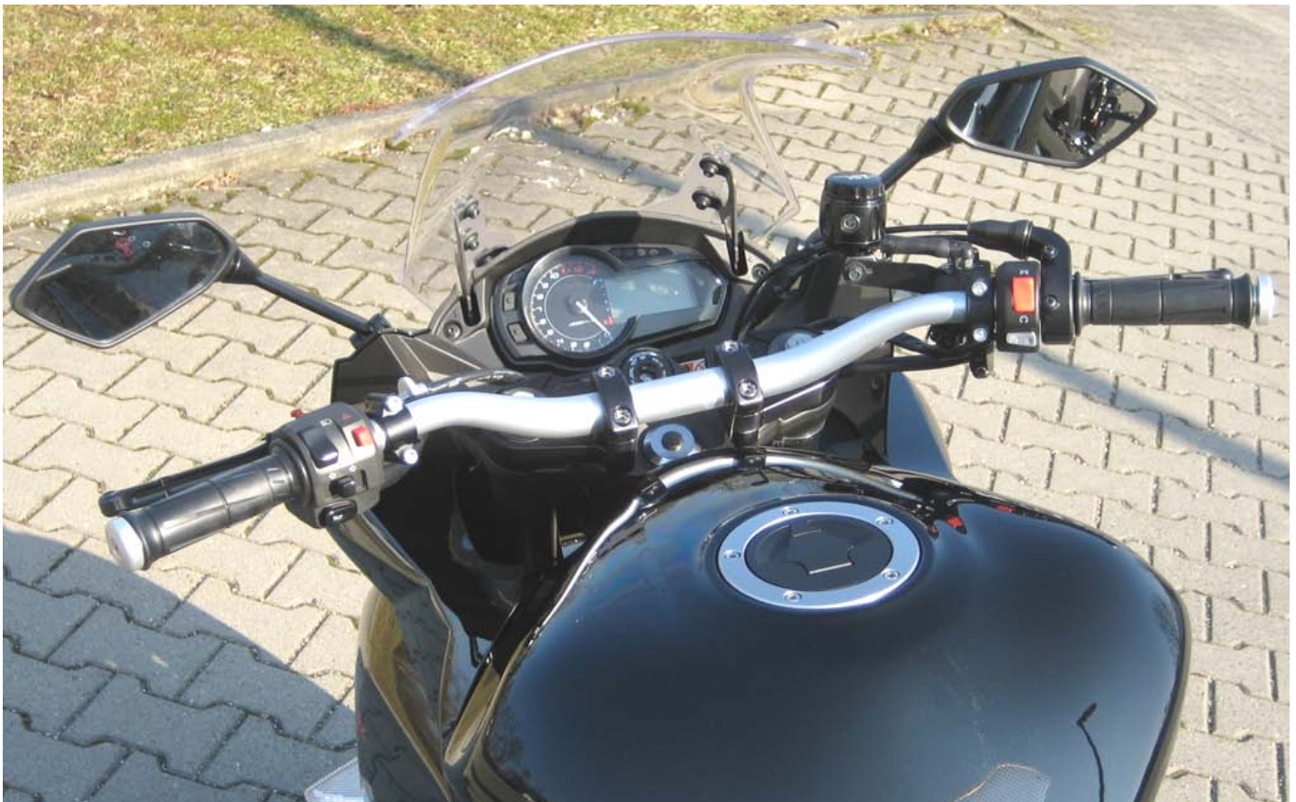
Mounted conversion kit